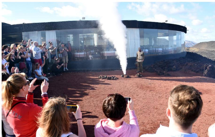
El recorrido por las Montañas del Fuego es obligatorio para todos los turistas que deseen conocer bien la isla.

Además apunta «el atractivo del municipio para la práctica del deporte al aire libre. El nombre de