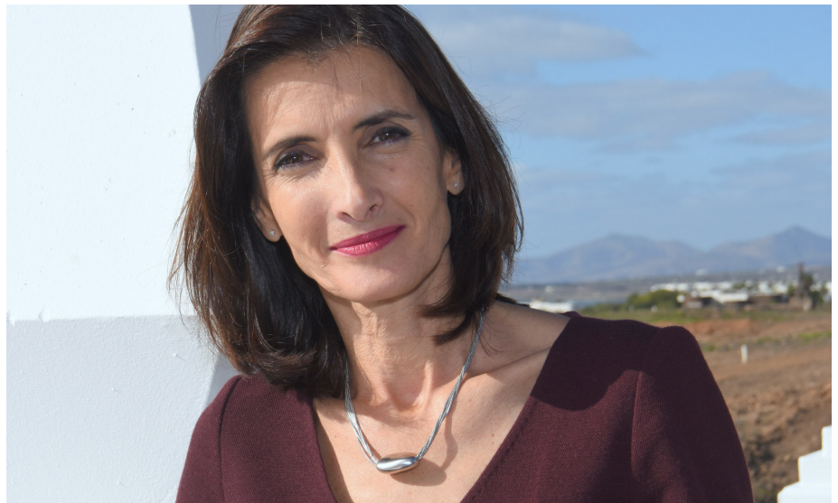
Lorenzo está dispuesta a que Canarias se convierta en un destino sostenible integral.

“ Estamos logrando la diversificación de mercados, potenciando la demanda en países como Italia, Francia, Rusia, Polonia, Hungría y recuperando otros que habían decrecido, como el nórdico y el peninsular”