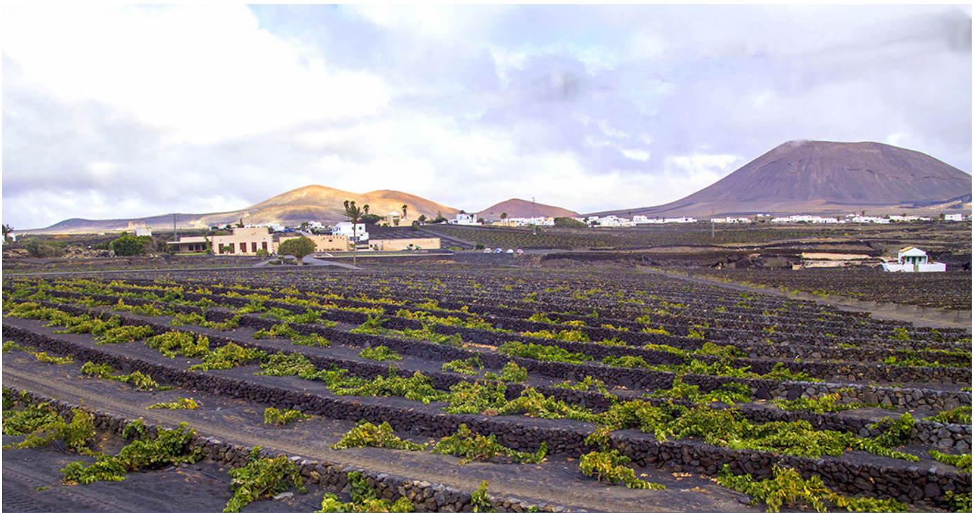
La Geria, un lugar idílico por su característico paisaje.

Con una salud desde el punto de vista turístico cada vez mayor, la isla de los Volcanes se mostrará en todo su esplendor en FITUR 2017