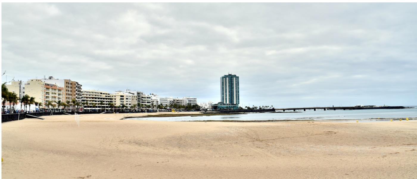
El Gran Hotel es todo un símbolo de la bahía capitalina.

mero lo forman el patrimonio, BIC, playas, eventos, museos, etc; el segundo, el alojamiento, restauración y transporte; y el tercer grupo de elementos está formado por los modelos de gestión. Arrecife es una ciudad turísticamente privilegiada a su manera. Tiene cada uno de los elementos que conforman un sistema turístico y se trabaja sobre cada uno de ellos sin dejar de lado al otro», señala. «Gracias a su conexión por mar, nos llegan anualmente un número importante de cruceristas que se ha ido incrementando con el tiempo; un aspecto de vital importancia para la ciudad del que se benefician los distintos sectores del transporte, del ocio, la restauración, etc. Éste quizá sea uno de nuestros puntos más fuertes».