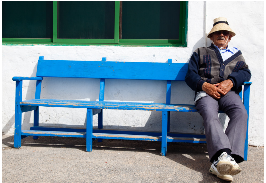
Lanzarote es sinónimo de tranquilidad y relax.