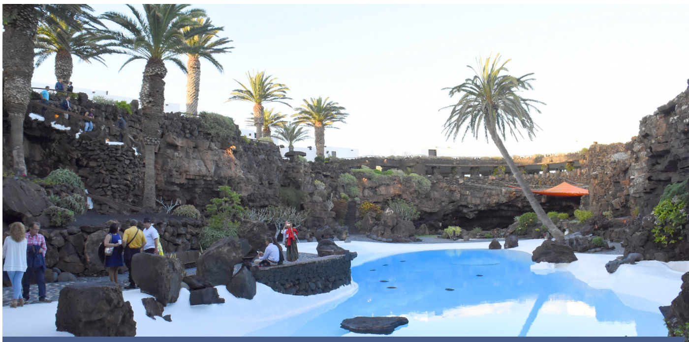
Los Jameos del Agua, una de las joyas de la corona de los Centros Turísticos.