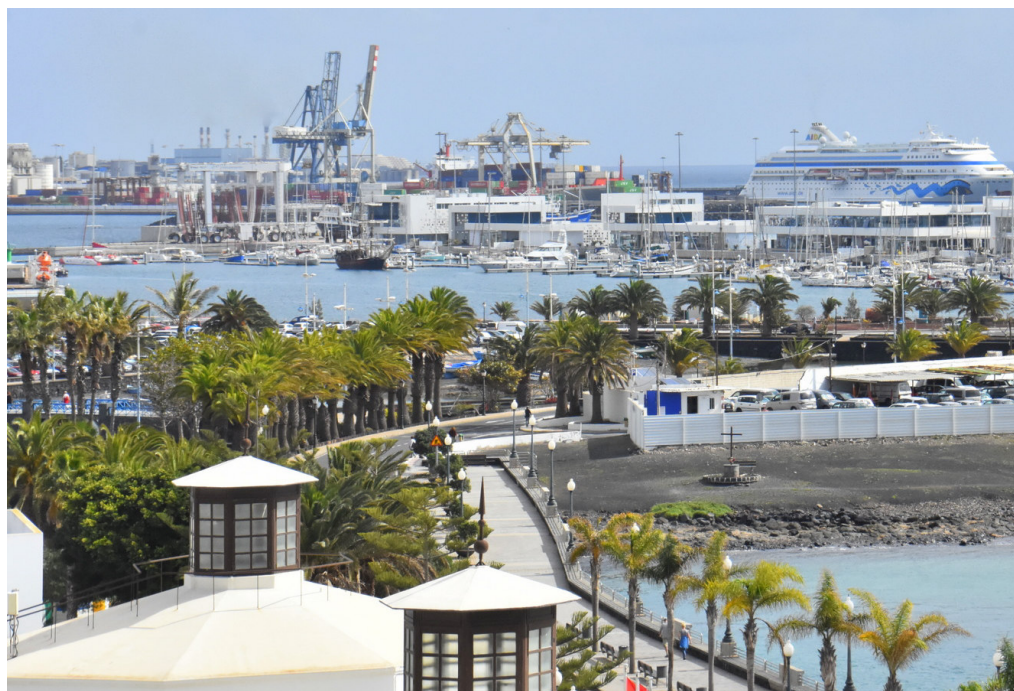
El turismo de cruceros sigue sumando adeptos.

Pese a todo, y como resulta lógico para un municipio ambicioso, aun queda mucho por lograr. «La lucha contra el todo incluido de la