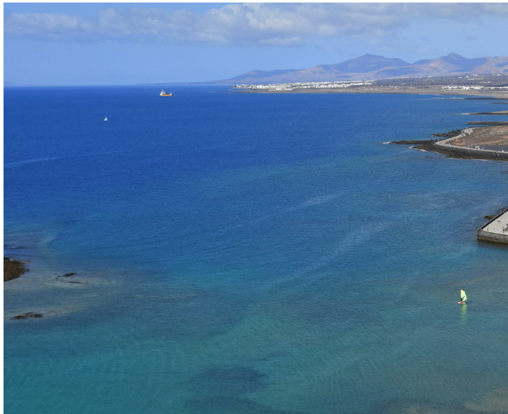
El océano baña toda la costa lanzaroteña y la convierte en lo que es.