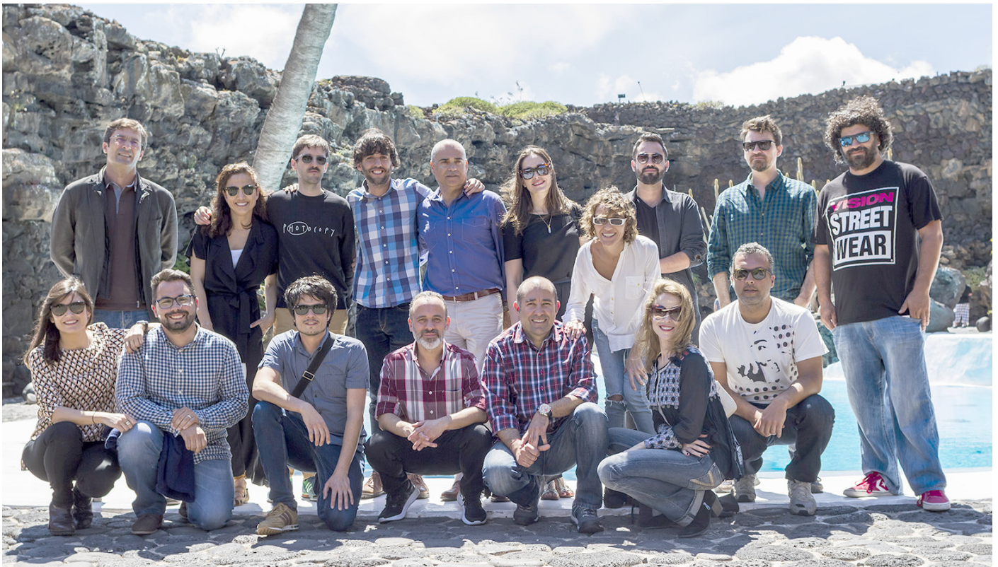
El jurado disfrutó en su visita a Jameos del agua.

Lanzarote continúa posicionándose en el panorama cinematográfico nacional con un certamen de altura