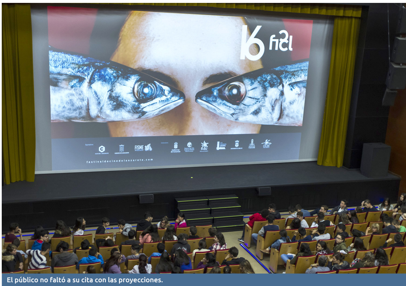
El público no faltó a su cita con las proyecciones.