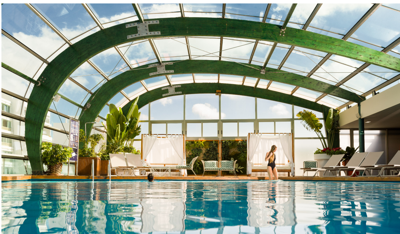
La piscina del Gran Hotel es un oasis de calma, incluso en los días más ventosos.

El único hotel cinco estrellas de la capital de la isla ha sabido evolucionar para adaptarse a las necesidades de los viajeros y usuarios del siglo XXI