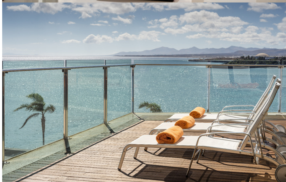
Cada pequeño detalle contribuye a hacer más agradable la estancia de los clientes.