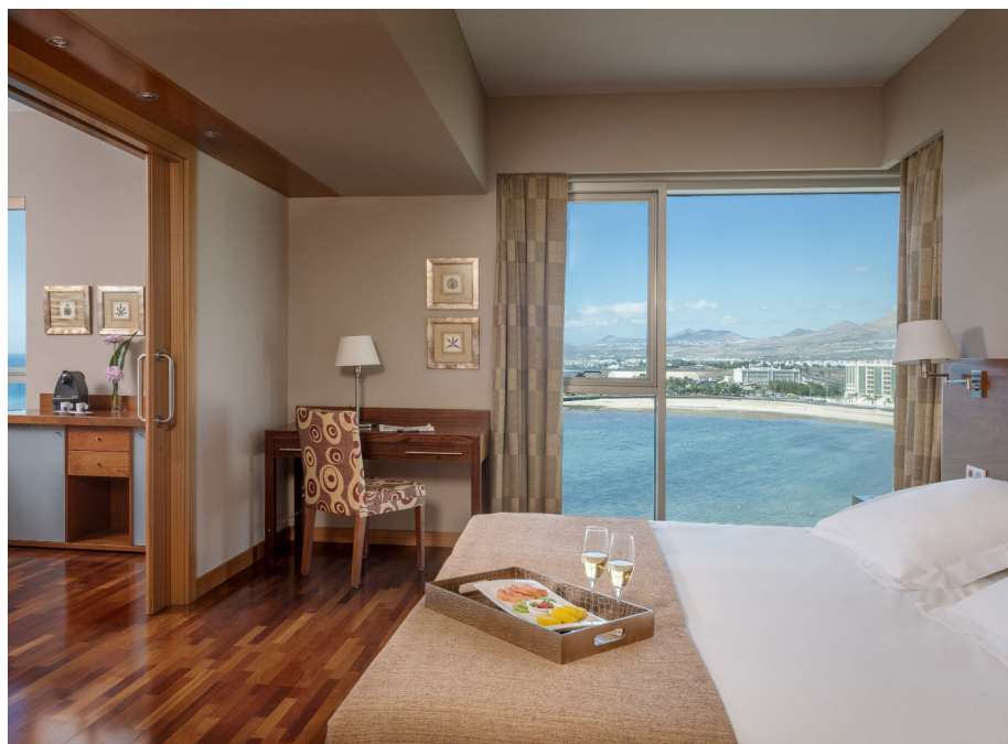
Las habitaciones tienen unas vistas increíbles.

En cualquier caso, el Arrecife Gran Hotel & Spa se ha convertido en un lujo que, por su proximidad y la variedad de ofertas que organizan, está al alcance de todos.