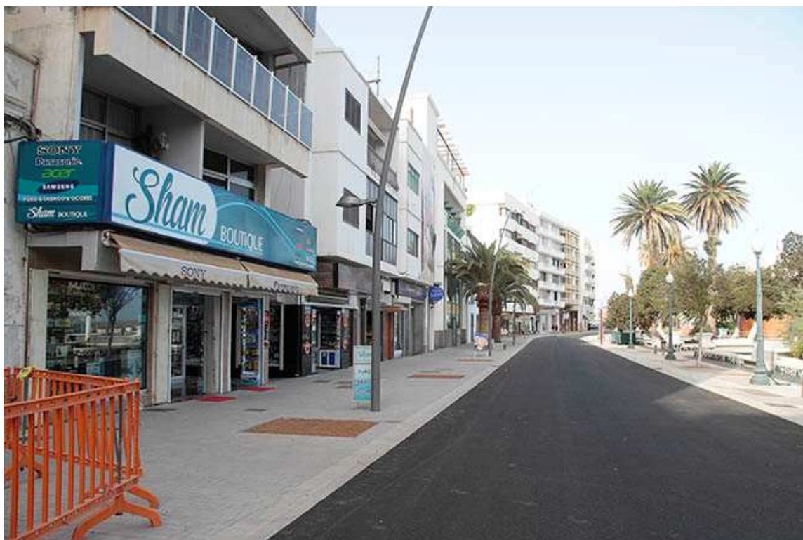
Imagen 1: Estado actual Avenida Marítima de Arrecife tras la obra.

Durante el año 2015 y parte del 2016 se ha ejecutado esta primera fase, cuyo final de obra y apertura al público, y tráfico ha originado incidencias que se analizarán a continuación.