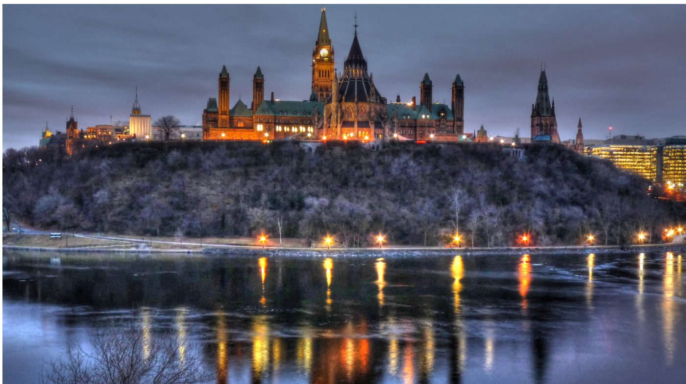
Canada ofrece paisajes de una belleza increíble.

Viajes Timanfaya propone un recorrido por el este del país recorriendo sus increíbles paisajes de naturaleza salvaje