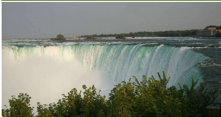
Las cataratas del Niágara, todo un símbolo del país.

tas que rodean la ciudad y disfrutar de vistas excepcionales. La Place Royal, el Barrio Petit-Champlain, el Río de San Lorenzo y el viejo puerto de la ciudad son visitas que no se deben pasar por alto.