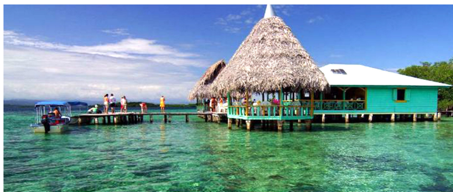
Las playas son muy bellas y atractivas para el turismo.

Por último, Playa Bonita es la opción preferida de los amantes del mar y sus delicias. Ubicada en la Provincia de Los Santos. La zona de Playa Venao se encuentra en el extremo sur de la península de Azuero. Con bares y restaurantes bordeando la playa, su ambiente tropical invita a sus visitantes a caminar en la arena, dar un tour por la selva, realizar deportes acuáticos, explorar los senderos que conducen a la cascada y pescar en las islas rocosas Los Frailes.