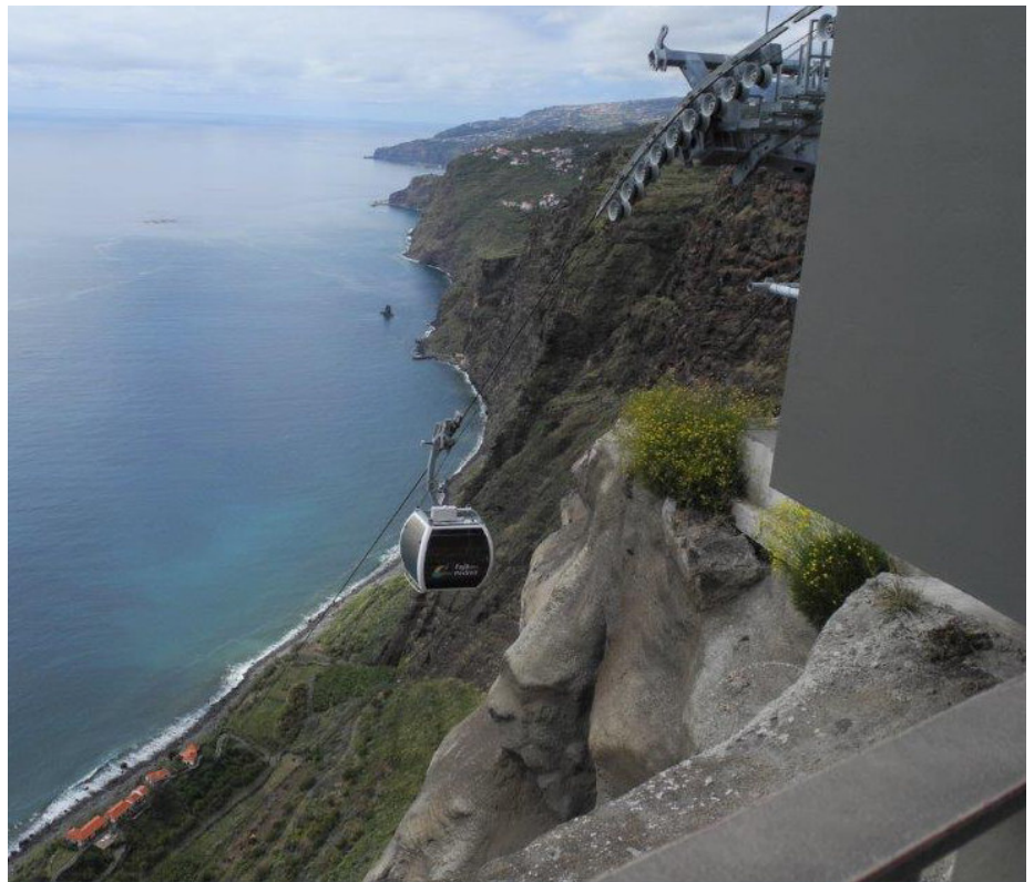
Existen muchos telesféricos y ascensores. El más importante es el que sube desde la zona Antigua de Funchal hasta la más alta, 15 minutos donde se puede apreciar la belleza de la ciudad.

Madeira posee numerosos jardines que pueden visitarse: su Jardín Botánico, con una superficie de más de 35.000 metros cuadrados y más de 2.000 plantas procedentes de todos los continentes; los Jardines de la Quinta de Boa Vista; el Jardín Tropical de Monte Palace, en el que además de plantas endémicas de varios países pueden ob-