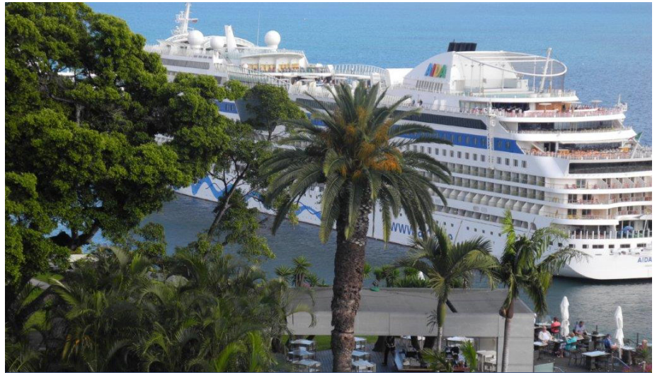
La isla recibe 1.300.000 turistas y 600.000 cruceristas al año .

“El buen clima, los paisajes impresionantes, la seguridad y la tranquilidad que se respira en todo el archipiélago, convierten a Madeira en un destino ideal”