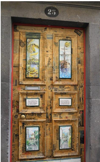
En Funchal hay un calle muy peculiar donde sus puertas estan todas pintadas de forma artística.