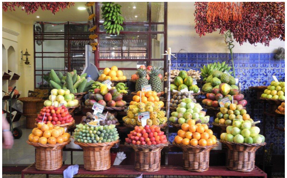
Las frutas exóticas y las flores son otros de los atractivos de la isla.