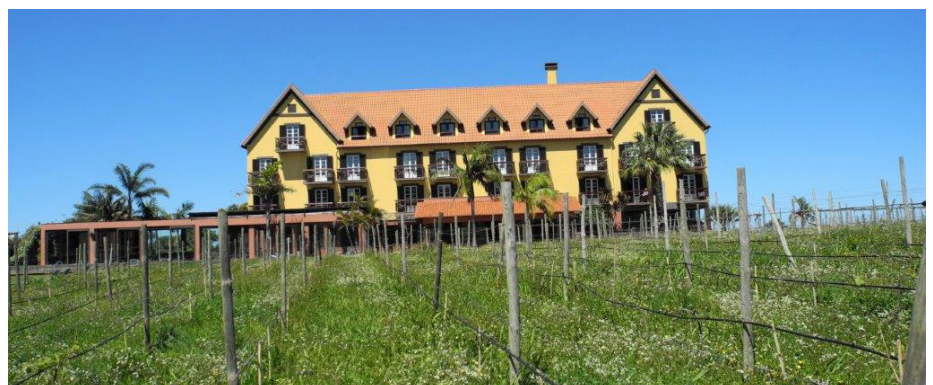
En zonas rurales existen hoteles que son una autentica maravilla para poder descansar en plena naturaleza.