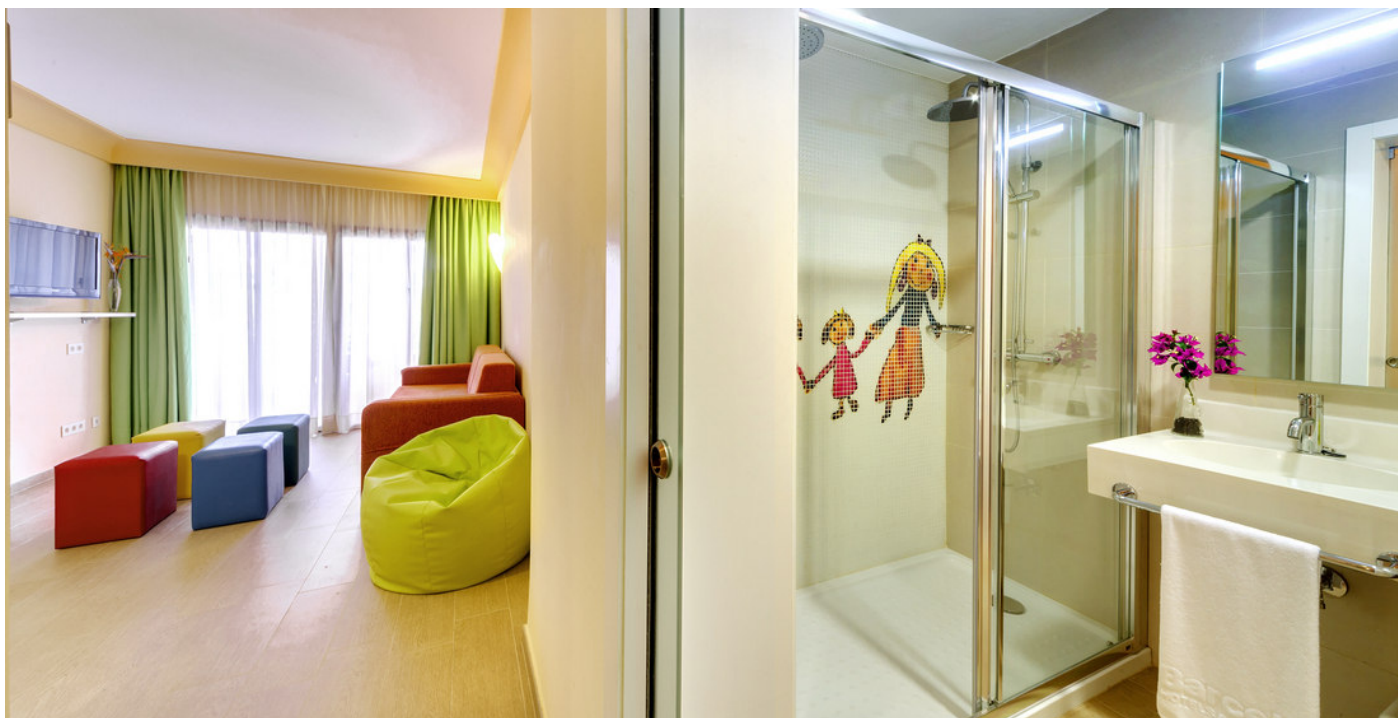
Las habitaciones son amplias y muy cómodas.

deluxe, así como suite familiar, habitación de hipoxia y Sports Room.