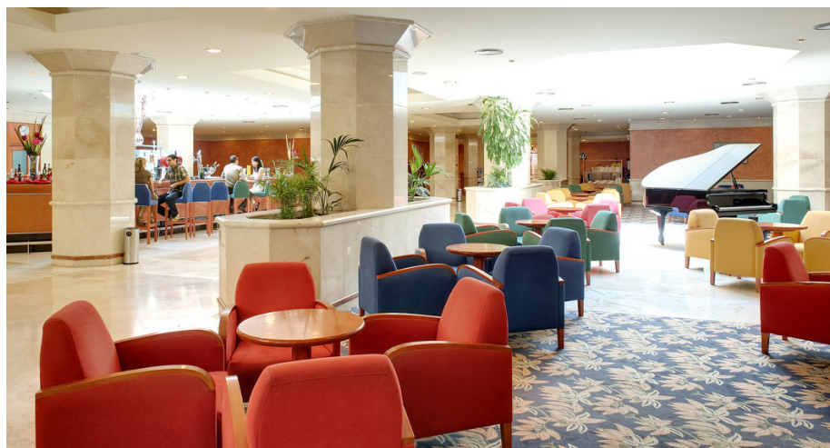
Las instalaciones comunes están pensadas para toda la familia.

La habitación de hipoxia es una habitación doble con colchones con tecnología 'ironman' y acondicionada con un equipamiento que simula las condiciones que se darían al dormir en altitud. Un ordenador se encarga de analizar la concentración de Oxígeno de la habitación y realiza un intercambio de gases que reduce el porcentaje de O 2 simulando así la altitud deseada. Esta habitación es la recomendada para deportistas de resistencia, ya que dormir en altitud durante estancias prolongadas aumenta el hematocrito (porcentaje de glóbulos rojos en sangre), los glóbulos rojos son los responsables de trans-