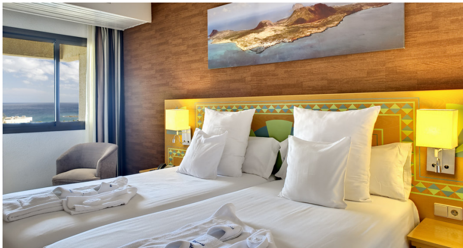
El hotel cuida cada pequeño detalle.

ticas la gastronomía también es un aspecto muy cuidado. El Occidental Lanzarote Mar cuenta con dos restaurantes, uno buffet y uno a la carta, especializado en comida mediterránea e italiana. Además dispone de un snack bar, el bar Coco, situado en la piscina familiar que tiene servicio de todo incluido durante el día. Otras instalaciones son el Bar Timanfaya con animación nocturna; el Bar Atlantida, un Piano bar relajado y el Bar Karma, situado en el área de sólo adultos, dónde pueden disfrutar de una piscina tranquila y cocteles exclusivos.